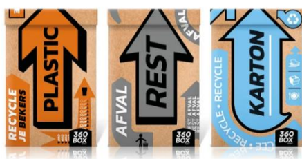
Boxen & Losse zakken

Dankzij het ruime aanbod aan inzamelsystemen kunnen de bekertjes en bakjes moeiteloos worden verzameld. Je hebt de keuze uit kartonnen inzamelboxen & losse zakken, rolcontainers van 240 en 1100 liter, en pers- en open opslagcontainers voor karton, PET-plastic en restafval. Zo kunnen we voor events van elke omvang een complete 'zero waste' oplossing leveren. Bepaal op revent.eco jouw ideale mix!