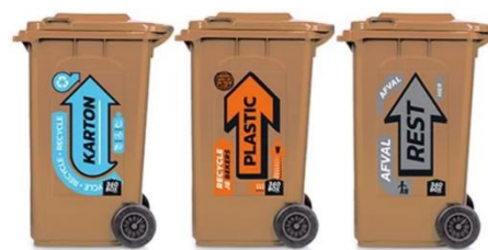
Containers en Overig